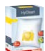
SB KK Original „Miele“ dulkių maišeliai