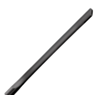
SFD 20 Lankstus lenkiamas antgalis siūlėms