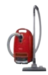
Complete C3 HEPA PowerLine SGFCO