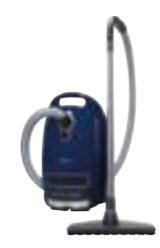
Complete C3 Parquet PowerLine SGSE1