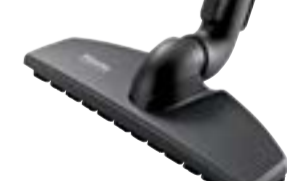
SBB 300-3 Parquet Twister šepetys parketui