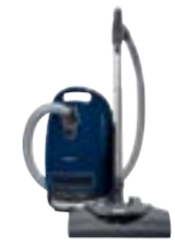
Complete C3 Electro Plus EcoLine SGSH2