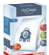
GN HyClean 3D Original „Miele“ dulkių maišeliai