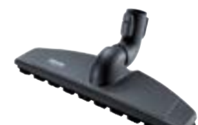
SBB 400-3 Parquet Twister XL šepetys parketui