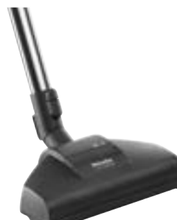
STB 205-3 Didelis Turbo šepetys