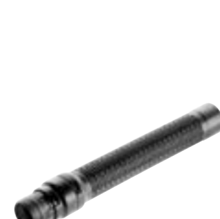
SFS 10 Lankstus siurbimo žarnos pailginimas