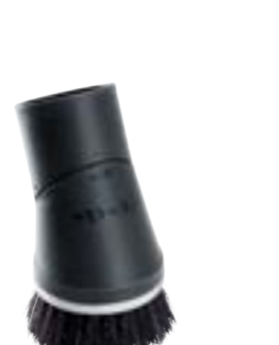
SSP 10 Siurbimo antgalis su lanksčiu sukamu sujungimu