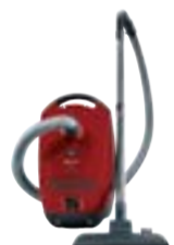
Classic C1 PowerLine SBAD0