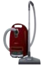
Complete C3 Cat & Dog EcoLine SGEE1