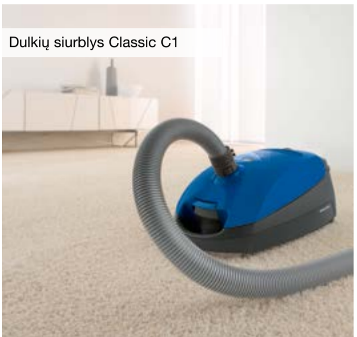
Dulkių siurblys Classic C1