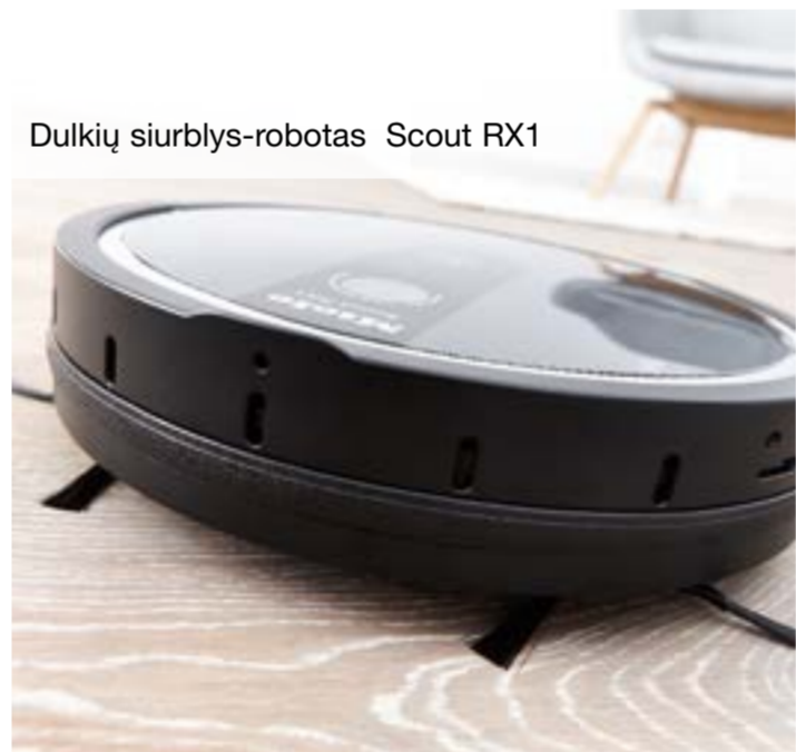
Dulkių siurblys-robotas Scout RX1