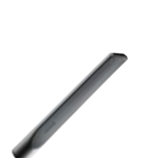
SFD 10 Ilgas antgalis siūlėms