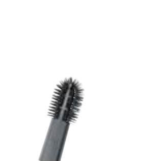
SHB 30 šepetys radiatoriams