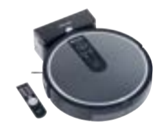
Scout RX1 SJQL0