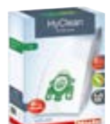
U HyClean Original „Miele“ dulkių maišeliai