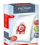
FJM HyClean 3D Original „Miele“ dulkių maišeliai