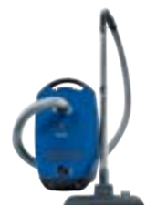
Classic C1 Junior PowerLine SBAD0