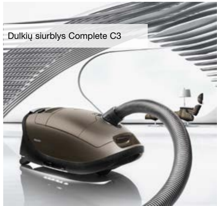
Dulkių siurblys Complete C3