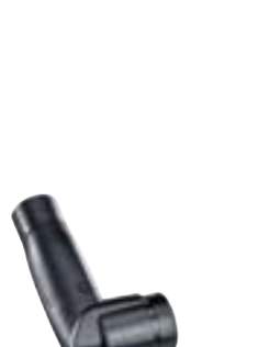
STB 20 Kompaktiškas Mini Turbo šepetys