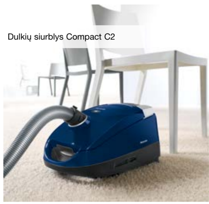
Dulkių siurblys Compact C2