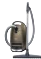
Complete C3 Brilliant EcoLine SGSH1