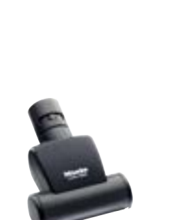
STB 101 Platus Mini Turbo šepetys