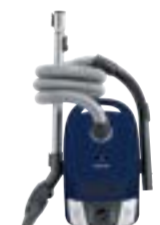
Compact C2 EcoLine SDAG1