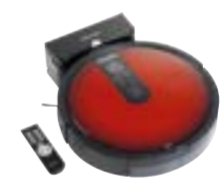
Scout RX1 Red SJQL0